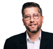
Vorsitzender der SPÖ Bundesratsfraktion Christian Fischer

Teilnahme an der Sommerschule verpflichtend. Damit soll sichergestellt werden, dass Kinder die nötigen Sprachkenntnisse erwerben, um dem Unterricht gut folgen zu können und ihre Bildungschancen zu verbessern.