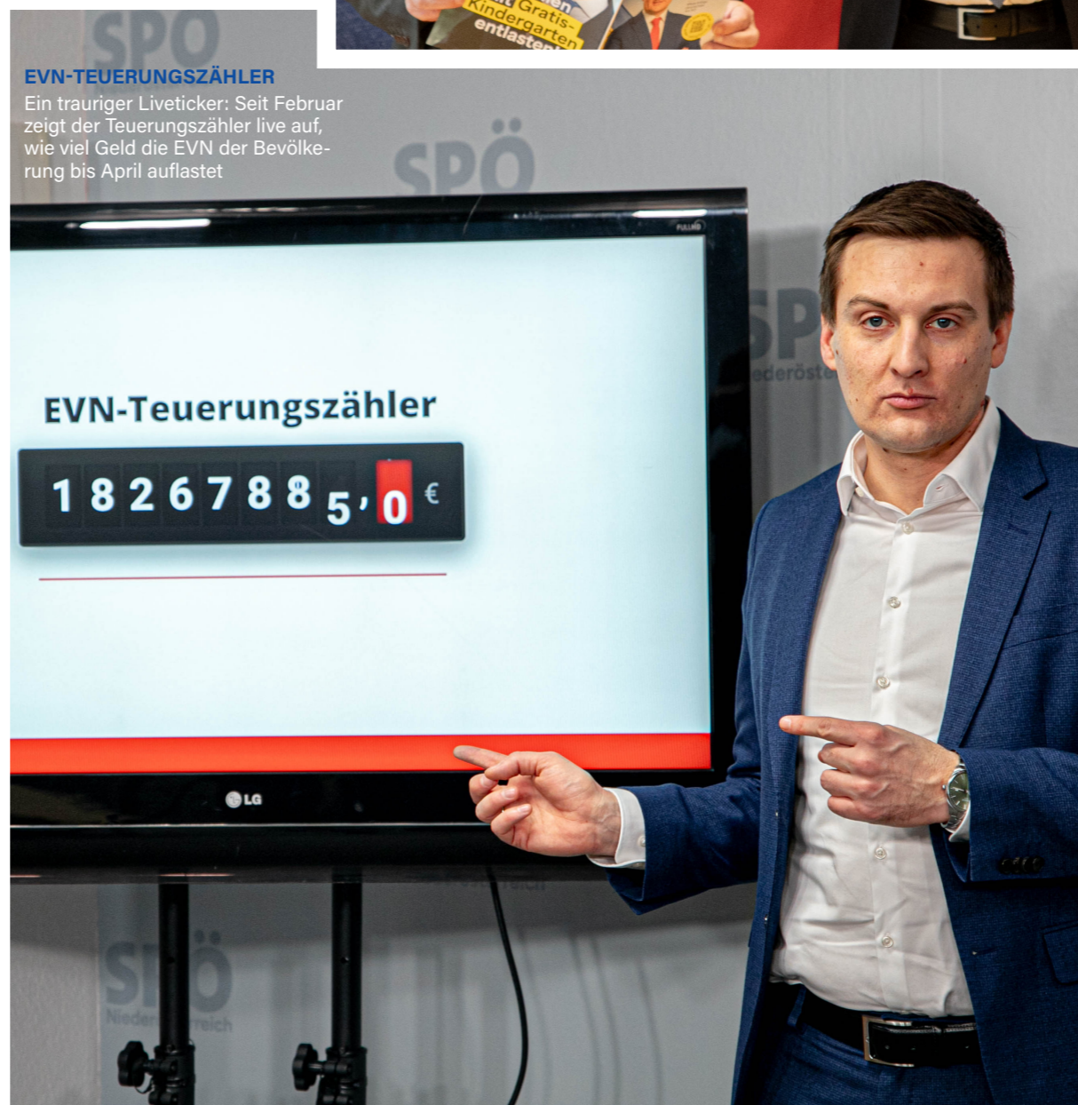
EVN-TEUERUNGSZÄHLER Ein trauriger Liveticker: Seit Februar zeigt der Teuerungszähler live auf, wie viel Geld die EVN der Bevölkerung bis April auflastet